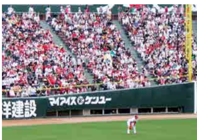
最初の球場広告看板