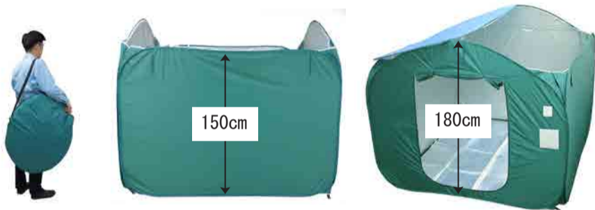
ベンリー間仕切りIII【希望小売価格 29,700円（税込）】

山野とは…福山市最北部の山間の地。龍頭峡と猿鳴峡の二つの峡谷がある。自然豊かで良質の水が豊富。万年健美はここ山野の地でくみ上げた水を使い、生産されている。五月三十日撮影。