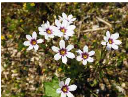
ニワゼキショウ。山野工場敷地内にて。

山野とは…福山市最北部の山間の地。龍頭峡と猿鳴峡の二つの峡谷がある。自然豊かで良質の水が豊富。万年健美はここ山野の地でくみ上げた水を使い、生産されている。五月三十日撮影。