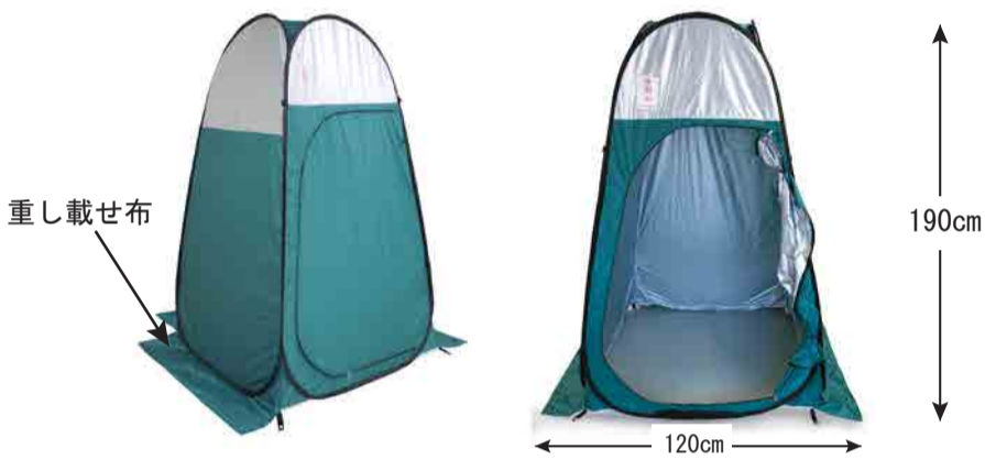
ベンリーテントII【希望小売価格 16,500円（税込）】

このたびベンリーテントとベンリー間仕切りをリニューアルしました。ベンリーテントは四面型になり安定感が増し、三面に重し載せ布がついており、ブロックなどを使って固定することもできます。付属品にハンマーが加わり、砂袋もサイズが大きくなり8枚になるなど用途に合わせてた設営が可能です。生地は難燃・抗菌加工がされており安心です。さらに内側から鍵をかけることもできます。