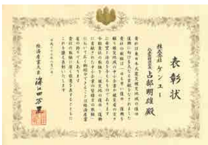
経済産業大臣からの表彰状