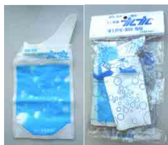
発売当初のプルプル