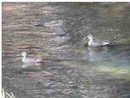
カモのつがい。龍頭峡周辺にて。