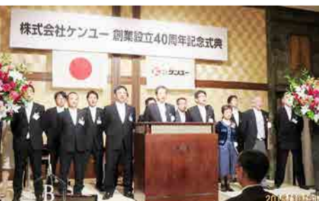
創業設立四十周年記念式典