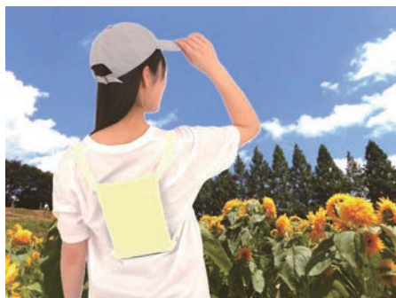
右上：新ベンリー袋 左上：ネックールわんこ小型犬用 下：背中クーラーアイボリー

「創業設立五十周年を迎えるにあたり、経営理念、方針を刷新。キヤッチコピを新たに作成。あわせて、向こう十年の重点項目を掲げた。『ユーザーを増やす』『ケンユートのブランディング』『技術の深耕と新商品』『新たなマーケット創出』『採用と育成』『DX、AIとの共存』である。では、その中で今年度何をすべきか？今年度の重点項目は、以下の通りとする。