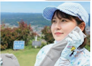
上:商品スペック。価格は2,970円(税込)。ケンユーネットがAmazonのみ購入可。一般店での販売はしていない。

顔がほてって別の保冷剤で顔と手を冷やしてました。埼玉県「生地」の肌触りが良かった。広島県「ひんやり」としてとても気持ちよかったです。広島県「毎年夏の暑さをどうして凌(こ)ごうか考えていてこの商品を使ってみようと思った。私は検針の仕事で毎日外仕事をしています。兵庫県「つめたくて気持ちいいけどちよつと重たい。広島県「工場勤務で昨年夏に熱中症になり今年の夏は危機感があります。香川県「酷暑の中での作業時に、他社の首元を冷やす商品と比較して使った中で御社の商品が一番長持ちだった。神奈川県「クールリングでは去年暑すぎたので今年の夏は少しでも快適に過ごしたい。大阪府「友達が使っていて良さげだった。東京都「思った以上にすごく涼しい。真夏の通勤に使わせてもらいます。岡山県「思ったより重量感がありました。冷たさが長続きして夏には最適だと思いました。広島県」:など。