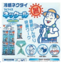
首筋冷却商品「ネックール」