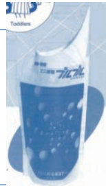
携帯ミニトイレ「プルプル」

高吸水性ポリマーとの出会いから、携帯ミニトイレ「プルプル」を開発。事業が大きく変わっていくきっかけとなった。