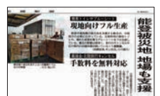
能登半島地震関連記事

2025 まんねん通信70号を発刊。 LDK（晋遊舎） 「おすすめ簡易トイレランキング」にてベンリー袋G 50回分セットがベストバイ&1位W受賞（WEB版、2025年5月）。