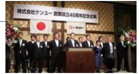
創業設立40周年記念式典

2016 熊本地震にて「ベンリー間仕切り」200張を提供。 創業設立40周年。記念式典を東京ベイコート倶楽部にて開催。