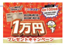
1万円キャンペーン開始

2023 トルコ地震にてベンリートイレ・ベンリーテント各200台、ベンリー袋30回分セット2,000セットを支援物資として提供。 当社史上初となるペット用商品「ネックールわんこ」発売。