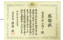
経済産業大臣より感謝状

2024 令和6年能登半島地震にてベンリー袋等20万回分を提供。 復旧対応等に貢献した企業として経済産業大臣より感謝状を拝受。