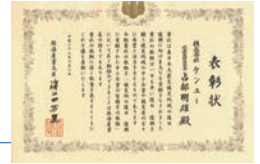
経済産業大臣より感謝状

2011 東日本大震災復興、復旧に貢献した中小企業に選ばれ、経済産業大臣より表彰状を拝受。